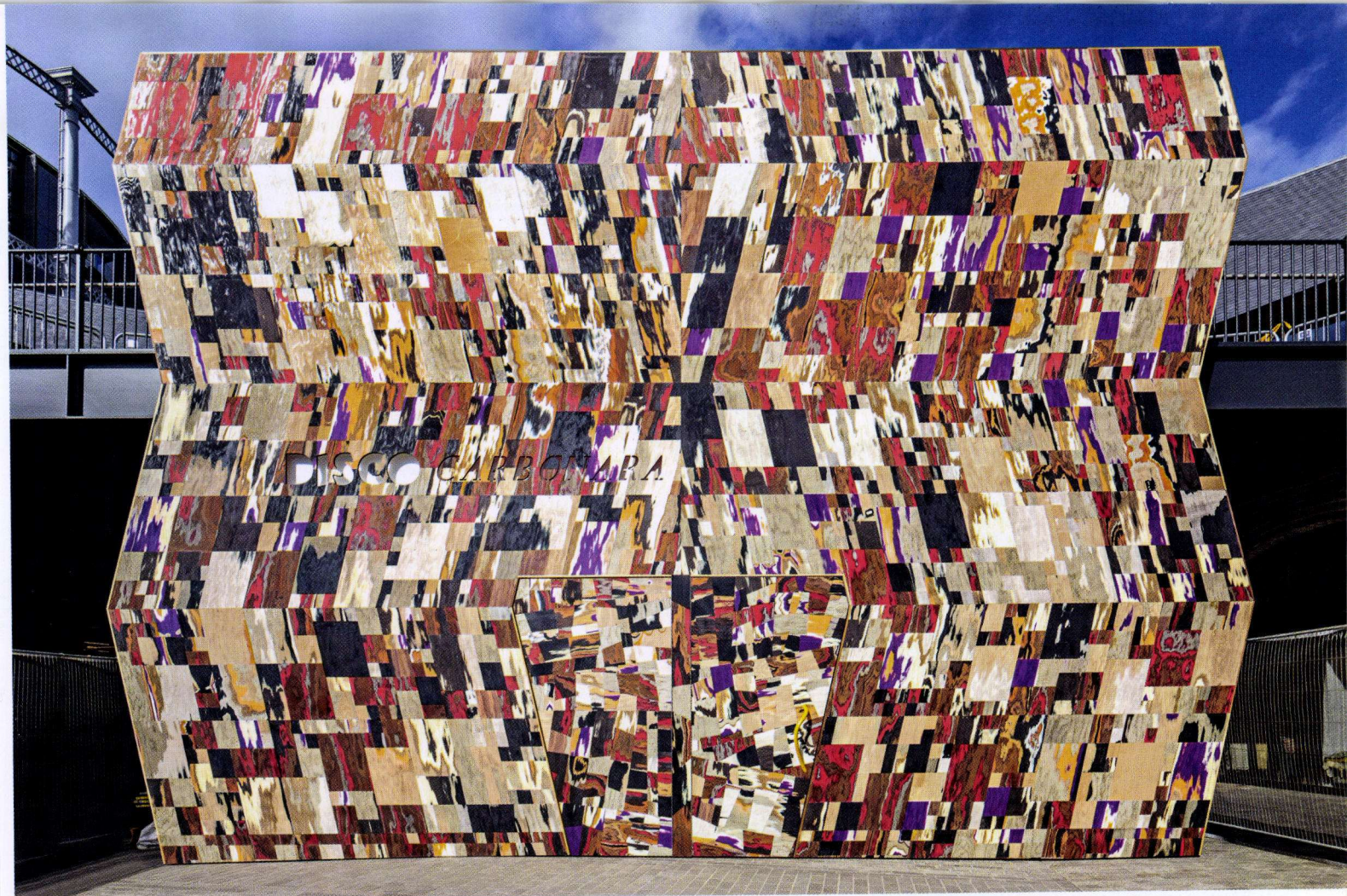
SOPRA Disco Carbonara , installazione per il London Design Festival 2019. Il disegno è creato con materiali di scarto di un'azienda, Alpi, specializzata in superfici decorative in legno.